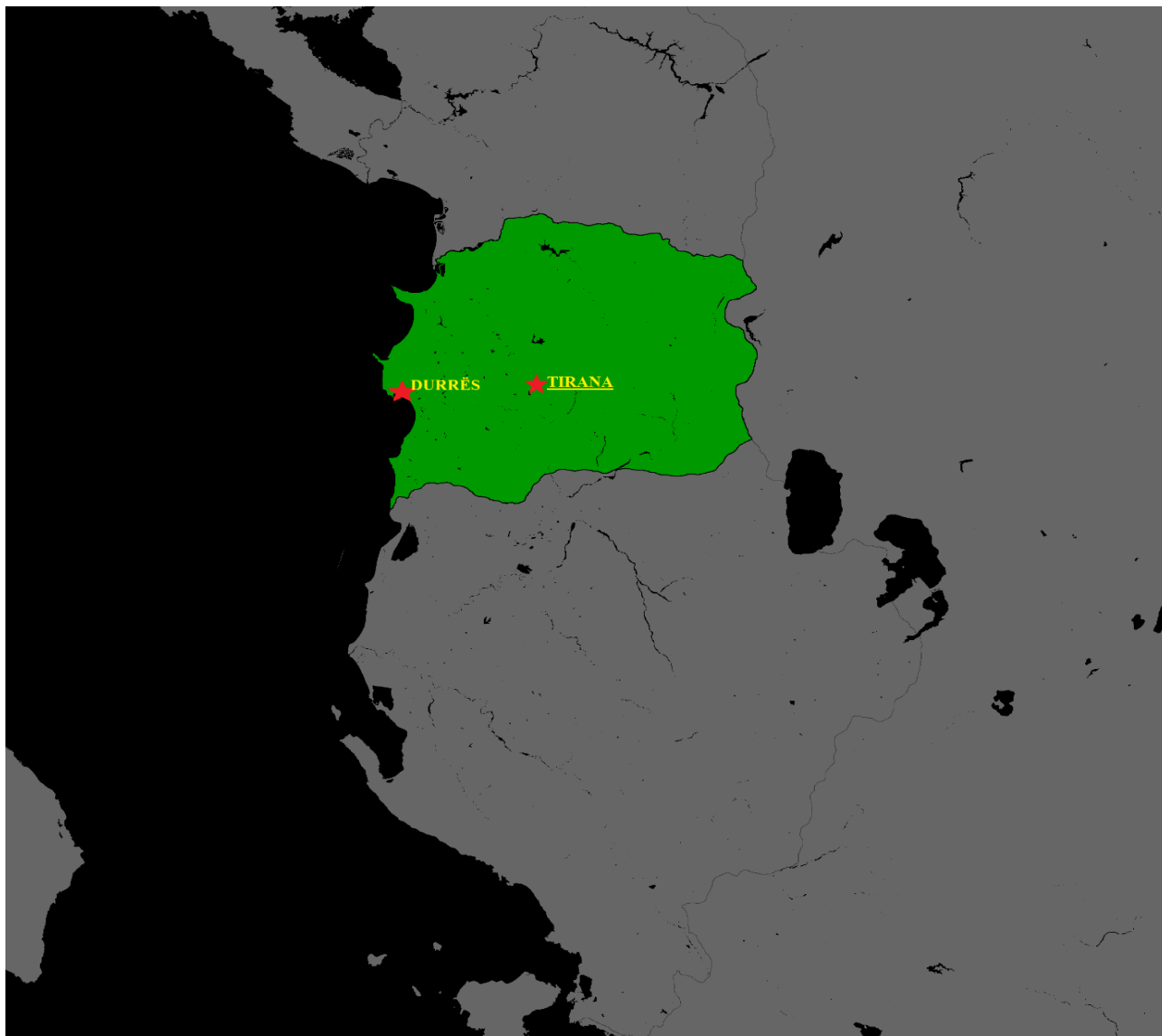
Мапа 1. Самопроглашена Република Централна Албанија (DamiKarv 2021)

чинилаца створила је услове за појаву паралелних државних пројеката у кључном тренутку настанка албанске државности. Овај дуализам није био само последица личних амбиција појединачних политичких лидера, већ дубље укорењених друштвених и културних процеса. Наслеђе ових подела и даље представља значајан фактор у савременом политичком развоју Албаније, утичући на њену спољнополитичку оријентацију и унутрашњу стабилност.